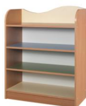
- KASIA 13px