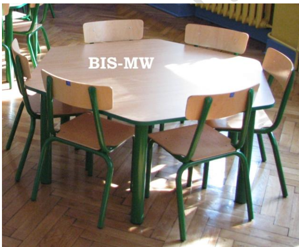
Stolik PUCHATEK sześciokątny i krzesła PUCHATEK