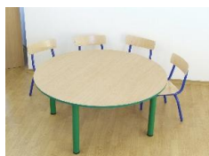
- Stolik – blat okrągły 1300

Seria PUCHATEK z regulowaną wysokością: stelaż okrągły 54 mm