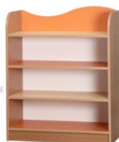
- KASIA 13pn