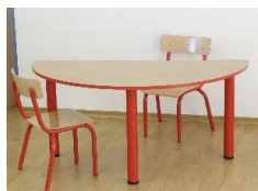
- Stolik – blat półokrągły 1300