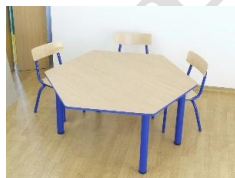
- Stolik – blat sześciokątny 1300