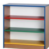
- KASIA 13 p