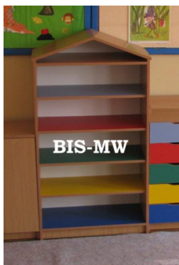
- REGALIK KOLOROWY Z DASZKIEM