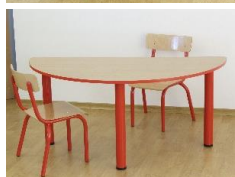
- Stolik – blat półokrągły 1300