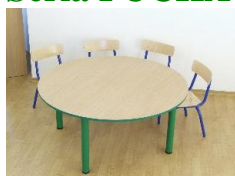
- Stolik – blat okrągły 1300