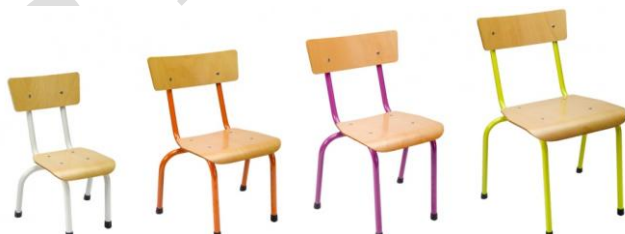
- Krzesło PUCHATEK