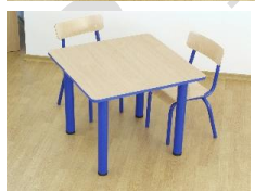
- Stolik – blat kwadratowy 650x650