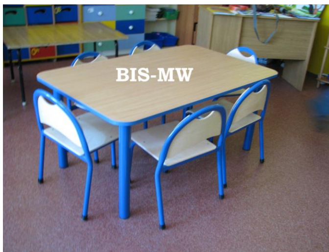
Stolik PUCHATEK prostokątny 1300 x 800 i krzesła DARTEK