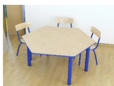
- Stolik – blat sześciokątny 1300