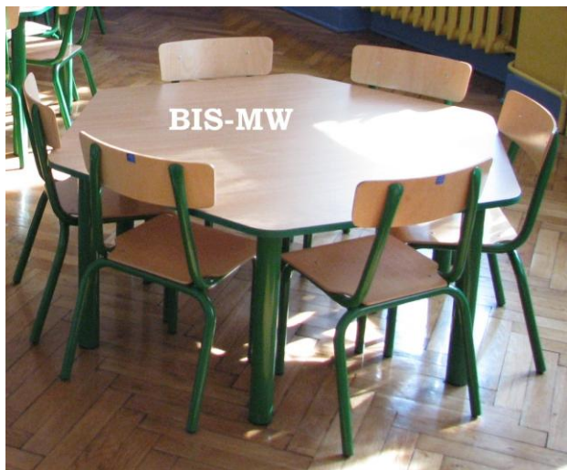
Stolik PUCHATEK sześciokątny i krzesła PUCHATEK