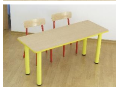
- Stolik – blat prostokątny 1300x650