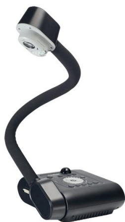
- AVer F50-8M