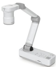
- Wizualizer Epson ELPDC21