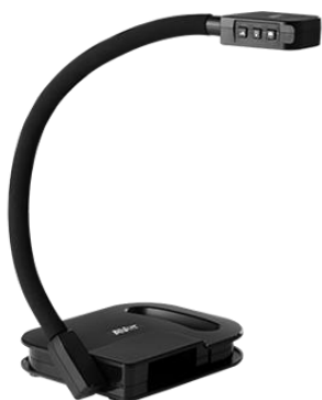
- AVer U70