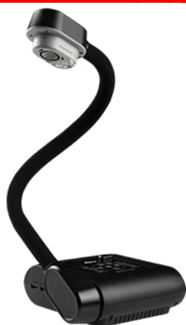
- AVer F17-8M