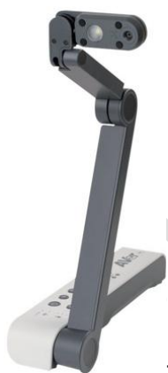
- AVer M15W