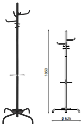
- Wieszak ARIZONA