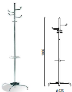
- Wieszak ARIZONA CR

Wieszak stalowy, malowany proszkowo na kolor Jet black RAL 9005 lub White aluminium RAL 9006 (ALU)