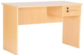
Biurko Vigo z 1 szufladą rogi proste rogi zaokrąglone