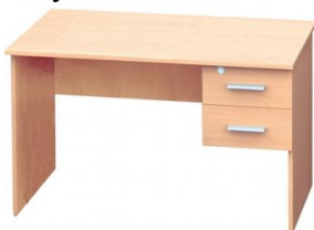
Biurko Vigo z 2 szufladami rogi proste rogi zaokrąglone