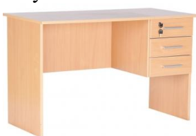
Biurko Vigo z 3 szufladami rogi proste rogi zaokrąglone