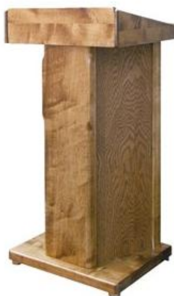
Mównica z godłem