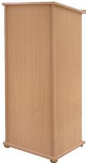
Mównica z godłem