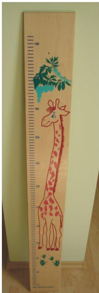
- Liniał wzrostu ucznia