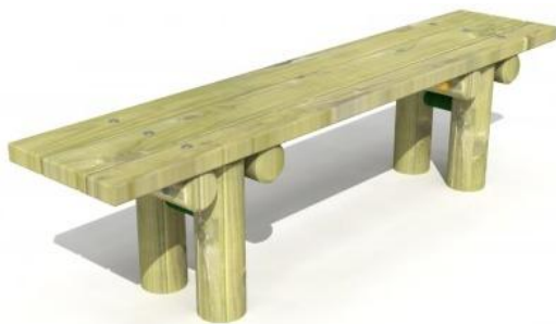
Ławka z bali stała