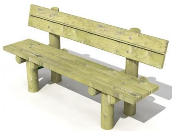
Ławka z bali stała z oparciem