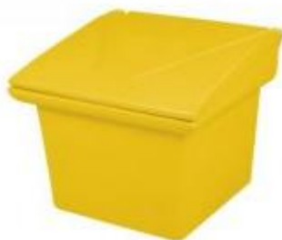
Pojemnik na sól i piasek