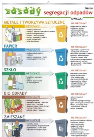
Zasady segregacji odpadów

(sprzedaż minimum 5 sztuk) 36,00 zł. /1 szt.