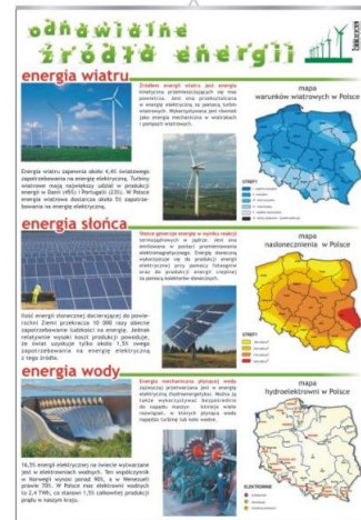
Odnawialne źródła energii