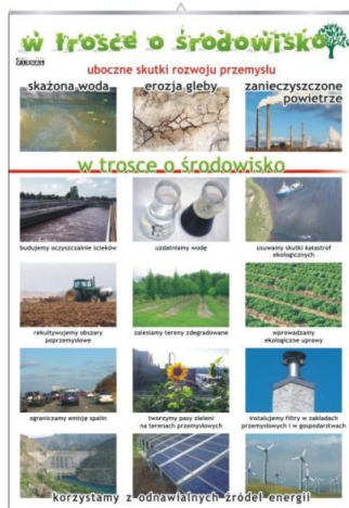
W trosce o środowisko