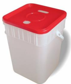
Pojemnik na baterie 15 L