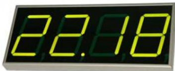
- Zegar ZG50S

ZG 40S Elegancki duży zegar, sterownik dzwonek z dużym, superjasnym wyświetlaczem 36 / 10 cm, w eleganckiej aluminiowej trwałej obudowie stosowany na duże korytarze i sale. Jest dobrze widoczny z 30m. Automatycznie włącza dzwonki szkolne, zamiast woźnej.