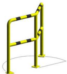
Barierka techniczna narożna 45° BTK45