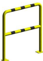
Barierka techniczna BT10