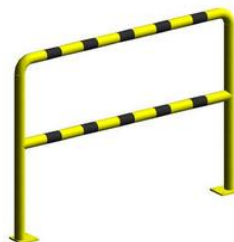
Barierka techniczna BT15