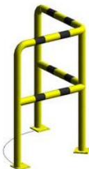
Barierka techniczna narożna 90° BTK90