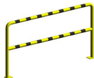
Barierka techniczna BT20