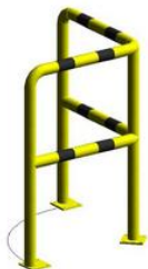
Barierka techniczna narożna 90° BTK90